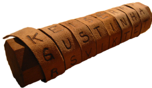
Figur 1: En skytale där texten "KEISER AUGUSTIN ..." skrivits.

Det är den sistnämnda egenskapen som gör att vi kan kommunicera utan tvetydigheter. Samma egenskap säger också att det är nyckeln k som måste hållas hemlig för att vår kommunikation ska hållas säker.