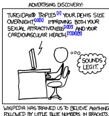
Figure: En kort seriestrip om hur vi är okritiska mot text som, till synes, har referenser.